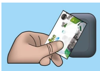
Figur 1 Misekortet används som nyckel till låsta återvinningsstationer, Låsta hus, Mise ÅVC (återvinningscentral) och Misebilen (mobil ÅVC).

En betald avfallsavgift (grundavgift och rörlig avgift) ger rätt till ett Misekort. Misekortet är en värdehandling som enbart gäller för den bostad som Misekortet blivit tilldelad. Misekortet fungerar som en nyckel vid återvinningscentral (ÅVC), återvinningsstationer (ÅS), Låsta hus och ska alltid uppvisas vid Mise ÅVC och Misebilen. För ej uppvisat Misekort debiteras en avgift enligt Mises avfallstaxa.