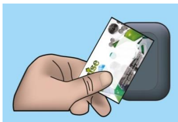
Figur 1 Misekortet används som nyckel till låsta återvinningsstationer, Låsta hus, Mise ÅVC (återvinningscentral) och Misebilen (mobil ÅVC).

En betald avfallsavgift (grundavgift och rörlig avgift) ger rätt till ett Misekort. Byggnadsägare som enbart betalar avfallsavgiftens första grunddel erhåller inte ett Misekort. Se under rubriken Beräkningsgrunder avgifter i detta dokument. Misekortet är en värdehandling och fungerar som en nyckel vid återvinningscentral, återvinningsstationer, Låsta hus och ska alltid uppvisas vid Mise ÅVC och Misebilen. Ej uppvisat Misekort debiteras en avgift enligt Mises avfallstaxan.