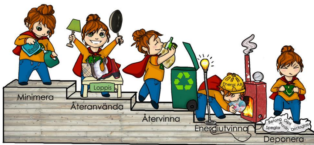
Figur 1. EU:s avfallstrappa är uppdelad i 5 steg: 1. Minimera mängden avfall. 2. Återanvändning. 3. Återvinning. 4. Energiåtervinning. 5. Deponering.

Mise är avfallsmyndighet för de kommuner på Åland som ingår i samarbetet. Mises uppgift är att ta hand om kommunernas lagstadgade uppgifter enligt Landskapslag om tillämpning av rikets avfallslag (2018:83). Avfallslagens syfte är att i första hand minimera avfall, i andra hand återanvända produkter, i tredje hand materialåtervinna avfallet, i fjärde hand energiåtervinna och sist deponera. Prioriteringsordningen kallas avfallstrappan och ska genomsyra allt arbete.