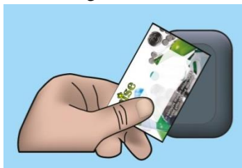
Figur 2 Misekortet används som nyckel till låsta återvinningsstationer, låsta hus, Mise ÅVC (återvinningscentral) och Misebilen (mobil ÅVC).

En betald avfallsavgift ger rätt till ett Misekort. Byggnadsägare som enbart betalar avfallsavgiftens första grunddel erhåller inte Misekort. Se under rubriken Beräkningsgrunder avgifter i detta dokument. Misekortet är en värdehandling som används som nyckel vid återvinningscentral, återvinningsstationer och låsta hus.