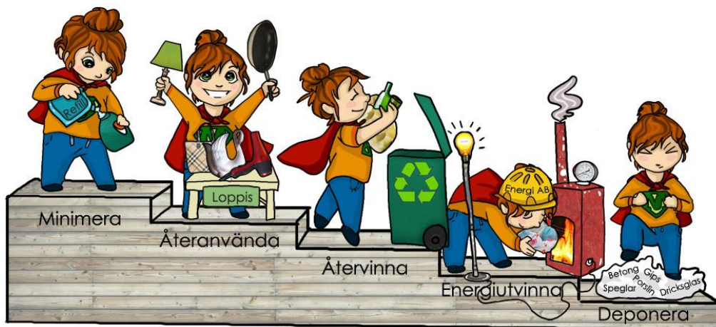
Figur 1. EUs avfallstrappa är uppdelad i 5 steg: 1. Minimera mängden avfall. 2. Återanvändning. 3. Återvinning. 4. Energiutvinning. 5. Deponering.

Mise är avfallsmyndighet för medlemskommunerna. Mises uppgift är att ta hand om kommunernas lagstadgade uppgifter enligt Landskapslag om tillämpning av rikets avfallslag (avfallslagen). Avfallslagets syfte är att i första hand minimera avfall, i andra hand återanvända produkter, i tredje hand materialåtervinna avfallet, i fjärde hand energiåtervinna och sist deponera. Prioriteringsordningen kallas avfallstrappan och ska genomsyra allt arbete.