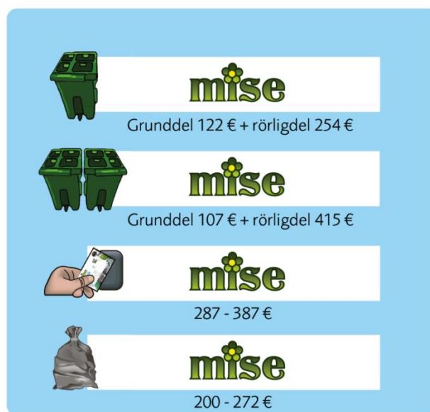
Figur 2 Översikt av Mises avgifter, observera att rörliga avgifter för Mise Fyran och Mise Åttan först kommer att antas inför 2020 års avfallstaxa, varvid rörliga avgifter endast kan ses som ungefärliga.

Den kommunala avfallsavgiften består av en grunddel och en rörlig del. Den rörliga delen kan göra att grunddelen blir högre eller lägre. I de fall Miseavgiften blir lägre betalas också avgifter till privata avfallsentreprenörer för de kunder som har dessa tjänster. Från 2020 kommer hela avfallsavgiften för flerbostadshus, vissa verksamheter, egnahemshus och fritidshus att betalas till Mise, det vill säga både grunddelen och den rörliga delen. Se figur 2 nedan. Hushållens ungefärliga totala kostnader för avfallshantering kan utläsas i illustrationen nedan.