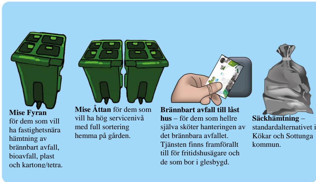
Figur 1 Mise avfallshanteringstjänster. Observera att Mise Fyran startar 2020.