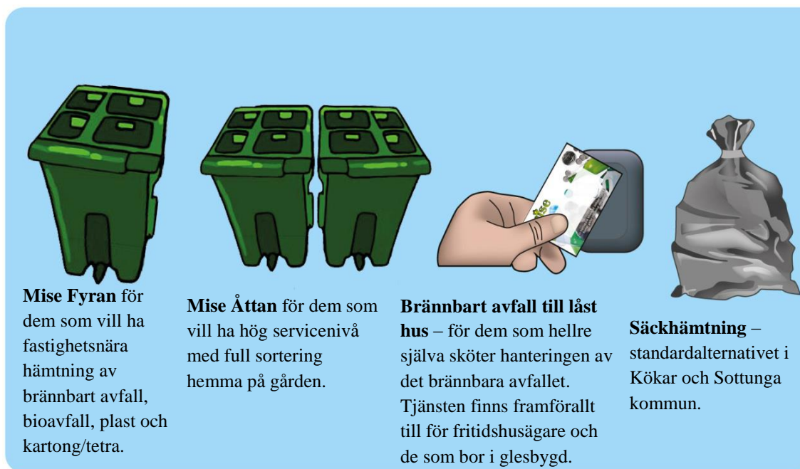
Figur 1 Mise avfallshanteringstjänster. Fyrpackstömningarna upphandlas under 2020.

Byggnadsägare som inte gör ett aktivt val ansluts till en av Mises tjänster beroende på om man bor i ett område som har upphandlad fastighetsnära avfallshämtning eller tjänsten låst hus.