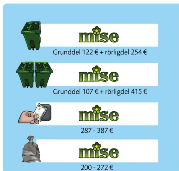
Figur 2 Översikt av Mises avgifter, observera att rörliga avgifter för Mise Fyran och Mise Åttan först kommer att antas inför 2020 års avfallstaxa, varvid rörliga avgifter endast kan ses som ungefärliga.

Den kommunala avfallsavgiften består av en grunddel och en rörlig del. Den rörliga delen kan göra att grunddelen blir högre eller lägre. I de fall Misesavgiften blir lägre betalas också avgifter till privata avfallsentreprenörer för de kunder som har dessa tjänster. Från 2020 kommer hela avfallsavgiften för flerbostadshus, vissa verksamheter, egnahemshus och fritidshus att betalas till Mise, det vill säga både grunddelen och den rörliga delen. Se figur 2 nedan. Hushållens ungefärliga totala kostnader för avfallshantering kan utläsas i illustrationen nedan.