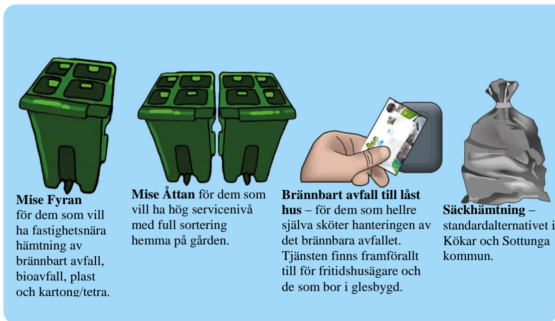
Figur 1 Mise avfallshanteringstjänster. Observera att Mise Fyran startar 2020.